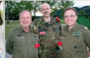
3 x Klein